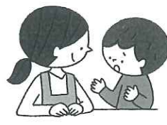
悩みがあるとき 相談できる