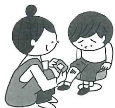
ケガをしたとき 救急処置してもらえます