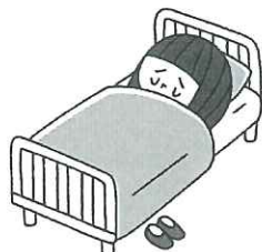
具合が悪いとき 一時的に休養できる